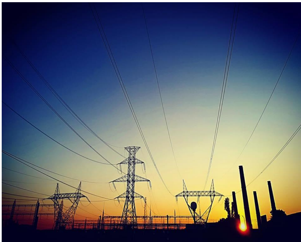
Stația București Sud