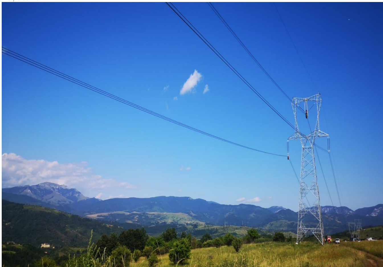
Porțile de Fier – Anina