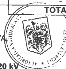
TABELUL 3 - Stații electrice de 220 kV

(1). In stația Porțile de Fier mai există o unitate de rezervă de 167 MVA